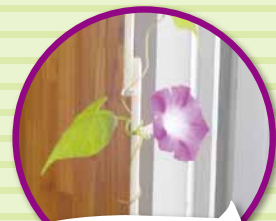
デイサービスに 一足先にアサガオが咲き 初夏を感じました。