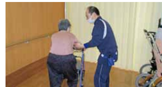
個別リハビリ(歩行訓練)の様子