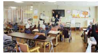
集団リハビリの様子

また、リハビリの中で他の方との交流を楽しんでいただけるよう体操やゲームを行ったり、当身を振り返っての会話や一緒に歌を口ずさんだりすることで、脳の活性化にもつながり心身の健康を支援させていただいております。