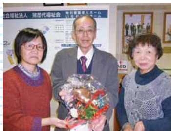
猪苗代町婦人会 様