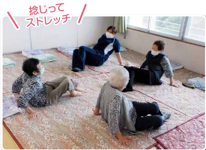
捻じってストレッチ