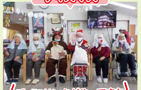
「デイにサンタがやってきた」