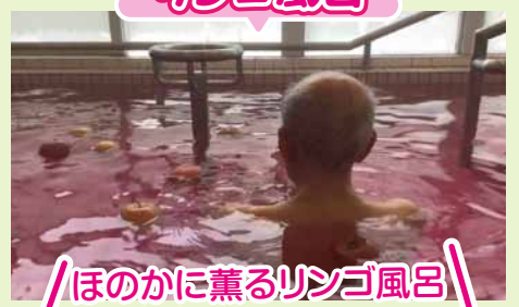
「ほのかに薫るリンゴ風呂」