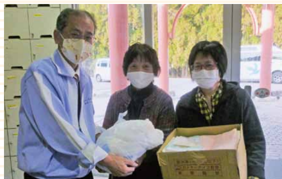
猪苗代町婦人会様よりタオルを寄贈していただきました